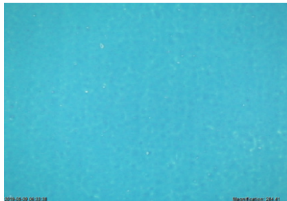
Mit X!Mask Farbdichte optimiert