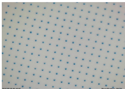
Mit X!Mask Farbdichte optimiert